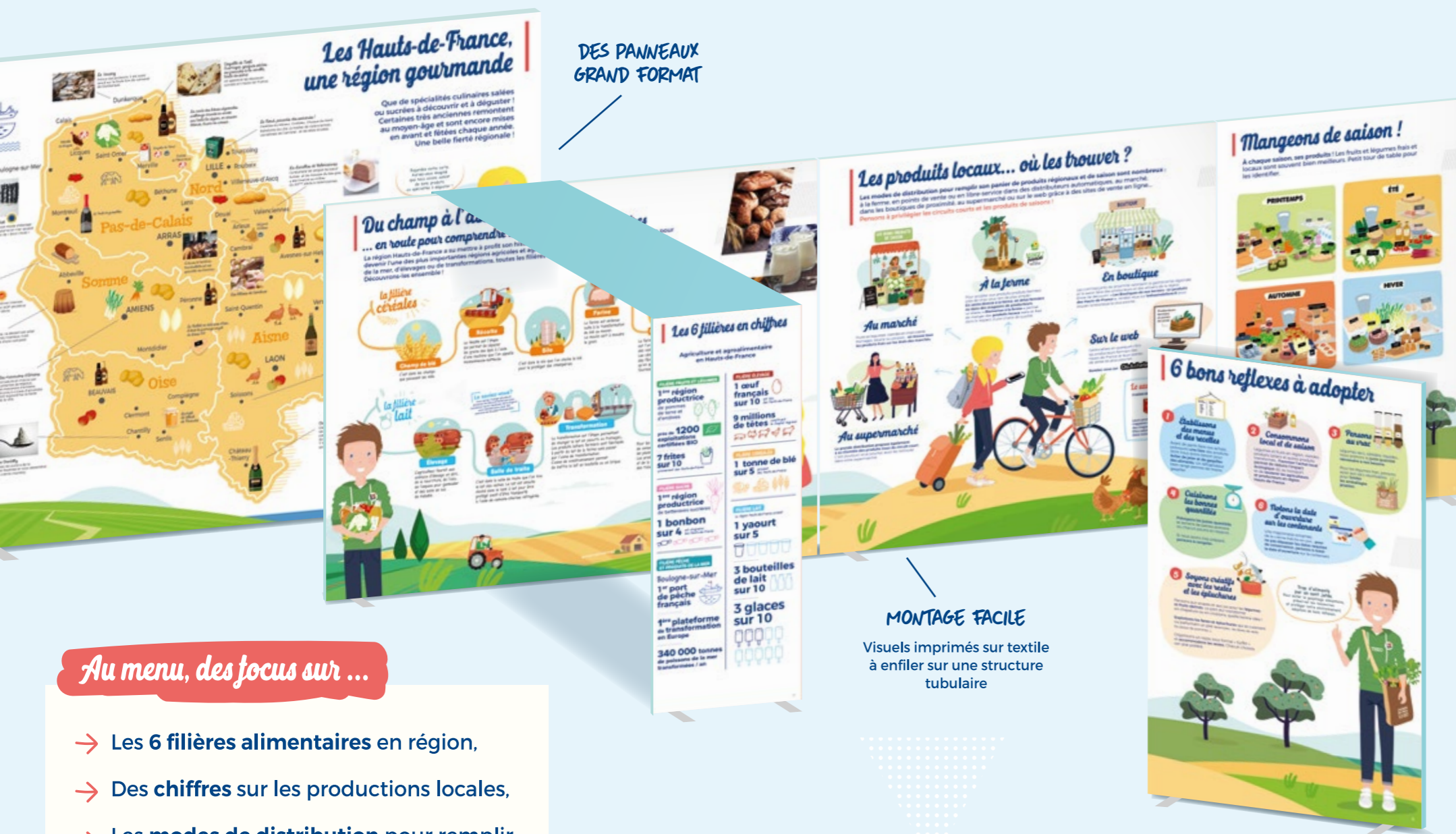
DES PANNEAUX GRAND FORMAT

Alice et Théo invitent adultes et enfants à découvrir les produits et la gastronomie de notre région. Une exposition ludique et pleine de surprises pour rassasier les gourmands et une expérience sensorielle autour des odeurs et textures.